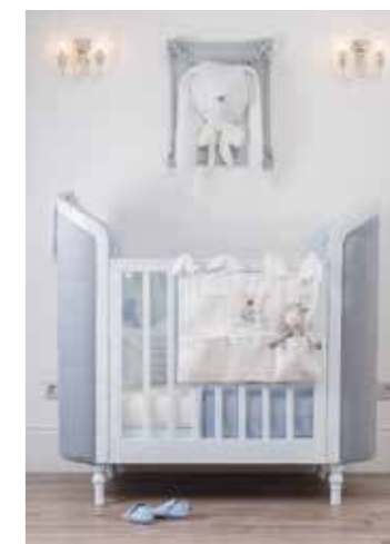
Кроватка ROTONDO, www.sophiestore.ru